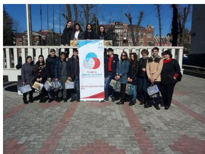
Акция милосердия «Посылка солдату.»