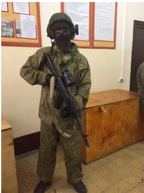
Фото учебных сборов