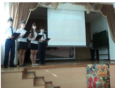
Урок мужества посвященный «Дню защитника Отечества!»